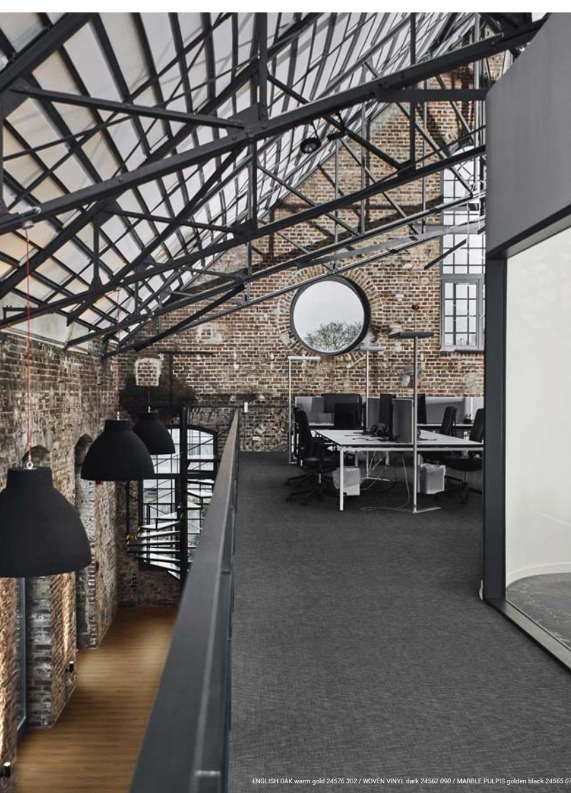
ENGLISH OAK warm gold 24576 302 / WOVEN VINYL dark 24562 090 / MARBLE PULPIS golden black 24565 077