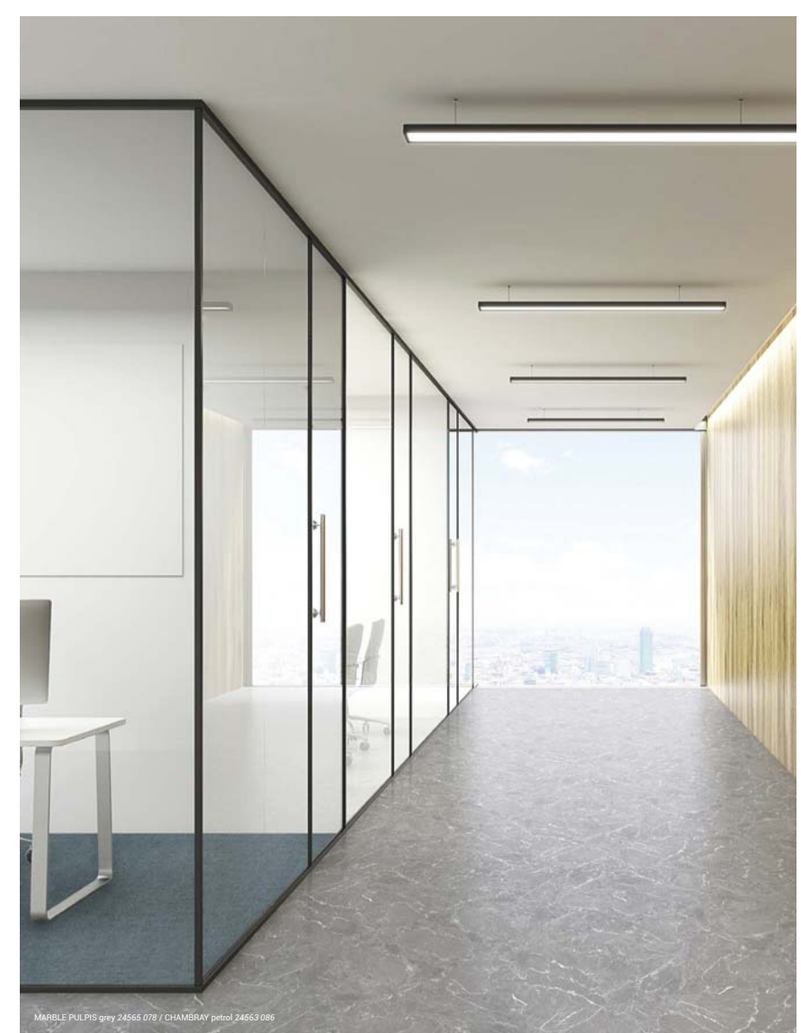
MARBLE PULPIS grey 24566 078 / CHAMBRAY petrol 24663 086