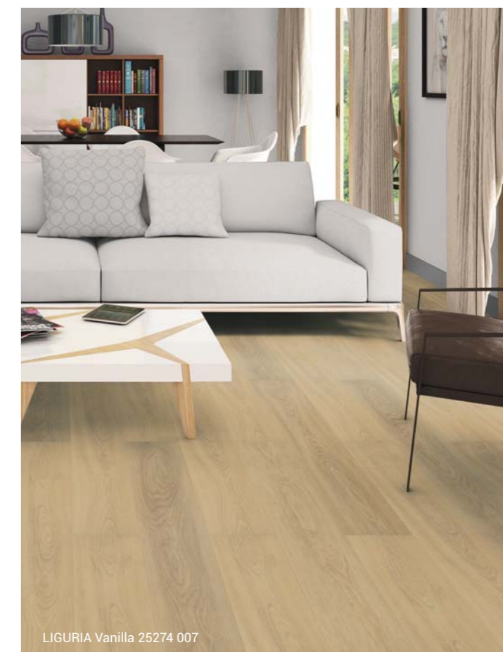
LIGURIA Vanilla 25274 007

25275 015 EAN : 34231286 15852 Plinthe : 35949 015 30 x 60 cm I.R. : 39,1%