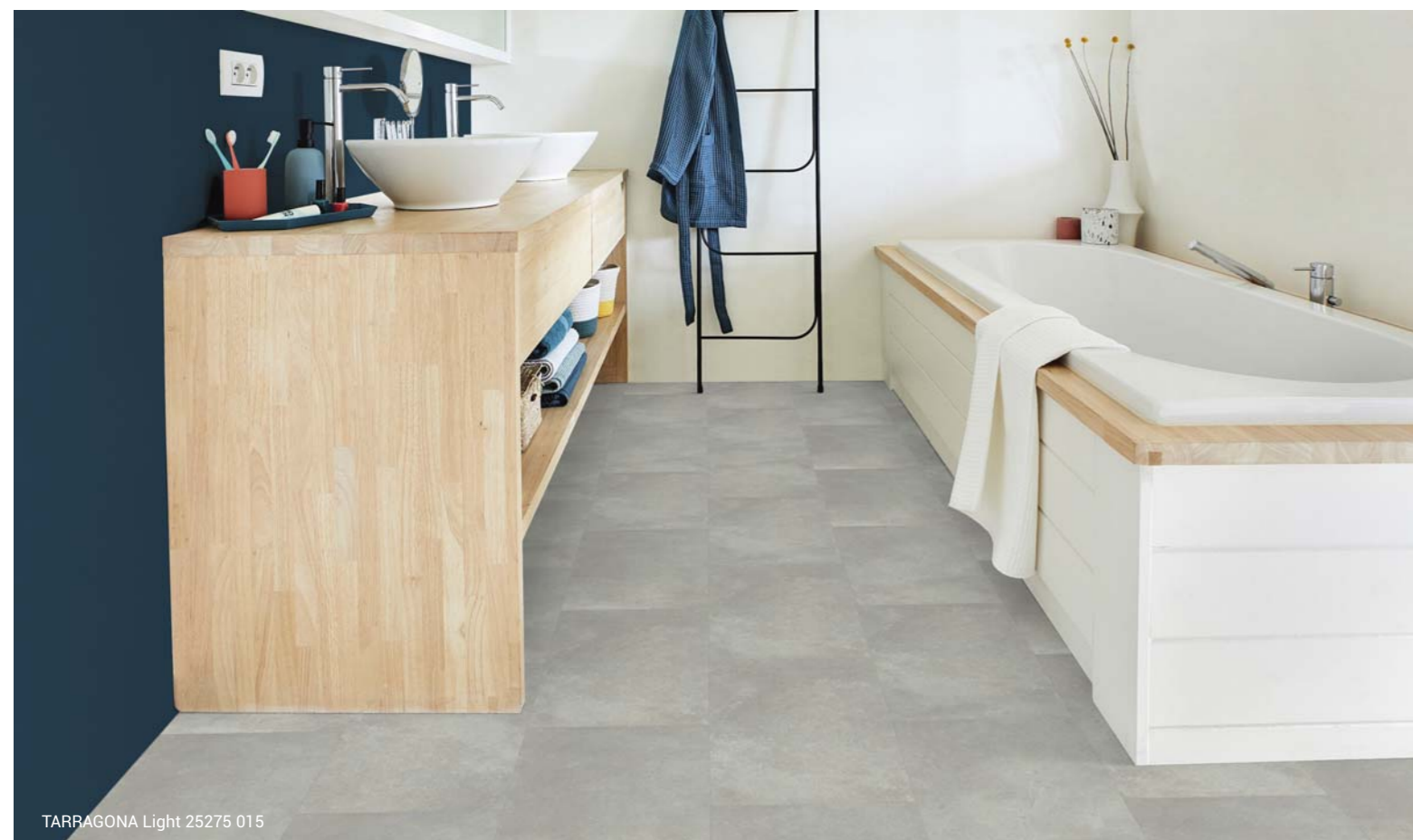
TARRAGONA Light 25275 015

*joints jusqu'à 6 mm de large et 3 mm de profondeur.