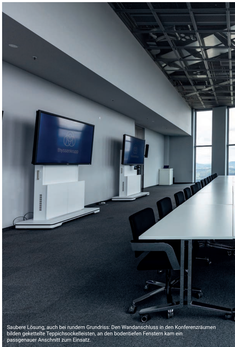
Saubere Lösung, auch bei rundem Grundriss: Den Wandanschluss in den Konferenzräumen bilden gekettelte Teppichsockelleisten, an den bodentiefen Fenstern kam ein passgenauer Anchnitt zum Einsatz.

Eine wichtige Rolle für die Planer des thyssenkrupp-Testturms spielte auch der Bereich Nachhaltigkeit. In diesem Punkt konnten die DESSO Teppichfliesen von Tarkett ebenfalls überzeugen: Über 95% dieser Teppichfliesen sind bereits gemäß den strengen „Cradle-to-Cradle“-Richtlinien zertifiziert. Nach einer genauen Prüfung und Bewertung u.a. der Inhaltsstoffe und Recyclingfähigkeit wurde DESSO Pure EcoBase® mit einem