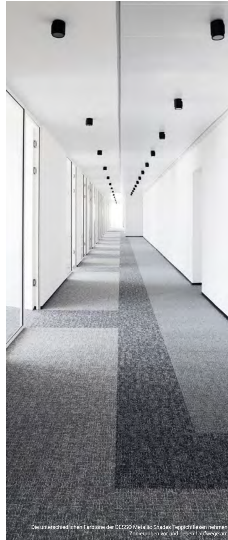
Die unterschiedlichen Farbtöne der DESSO Metallic Shades Teppichfliesen nehmen Zonierungen vor und geben Laufwege an.