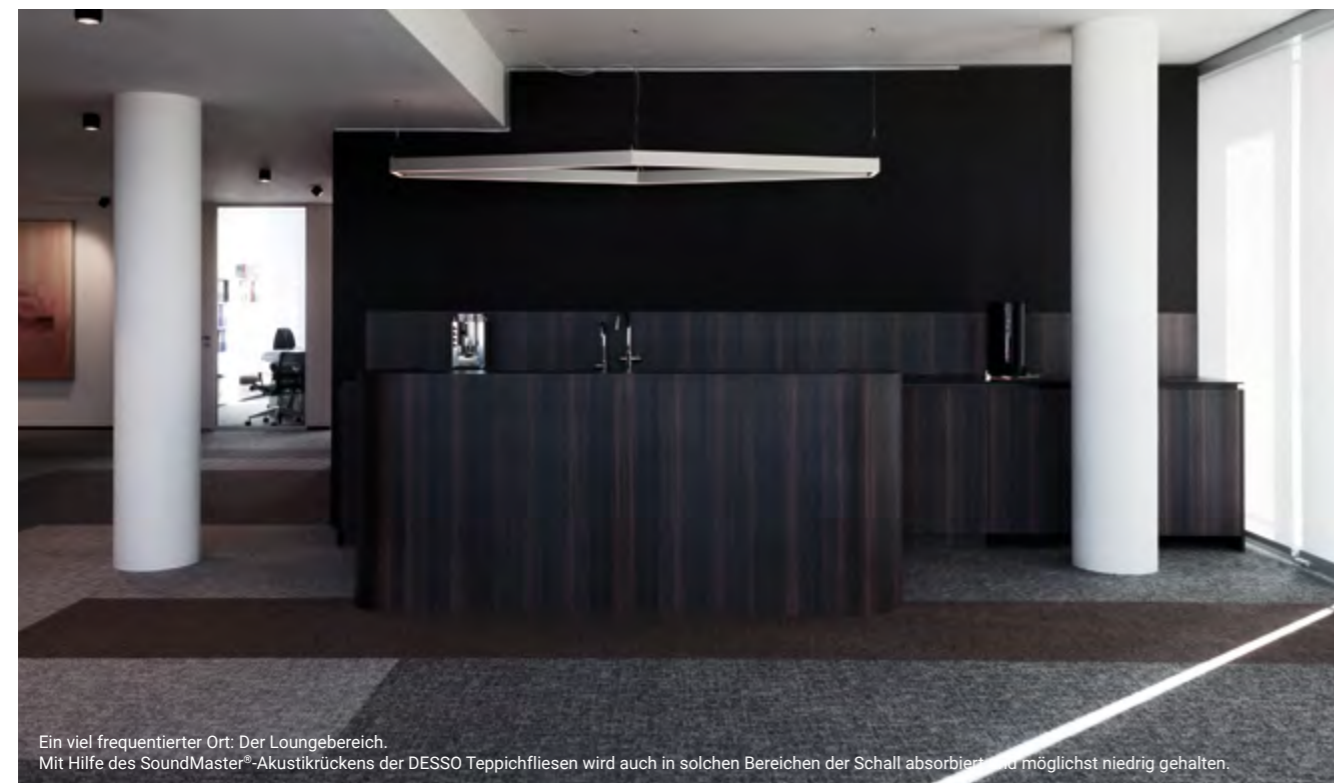
Ein viel frequentierter Ort: Der Loungebereich. Mit Hilfe des SoundMaster®-Akustikrücken der DESSO Teppichfliesen wird auch in solchen Bereichen der Schall absorbiert und möglichst niedrig gehalten.

Nachdem der Rohbau fertiggestellt war, galt es den Räumen mit dem bis dato recht kühlen Ambiente eine eigene Persönlichkeit zu verleihen. Der Wunsch war eine hochwertige Büroumgebung, die gleichzeitig elegant und warm wirken sollte. Mit einer Fläche von über 2.000 Quadratmetern auf zwei Etagen trägt der Boden maßgeblich zum Gesamteindruck der neuen Anwaltskanzlei bei. „Als ich die Farbtöne und Struktur der Teppichfliesen DESSO Metallic Shades zum ersten Mal sah, musste ich sofort an einen Anzugstoff denken“,