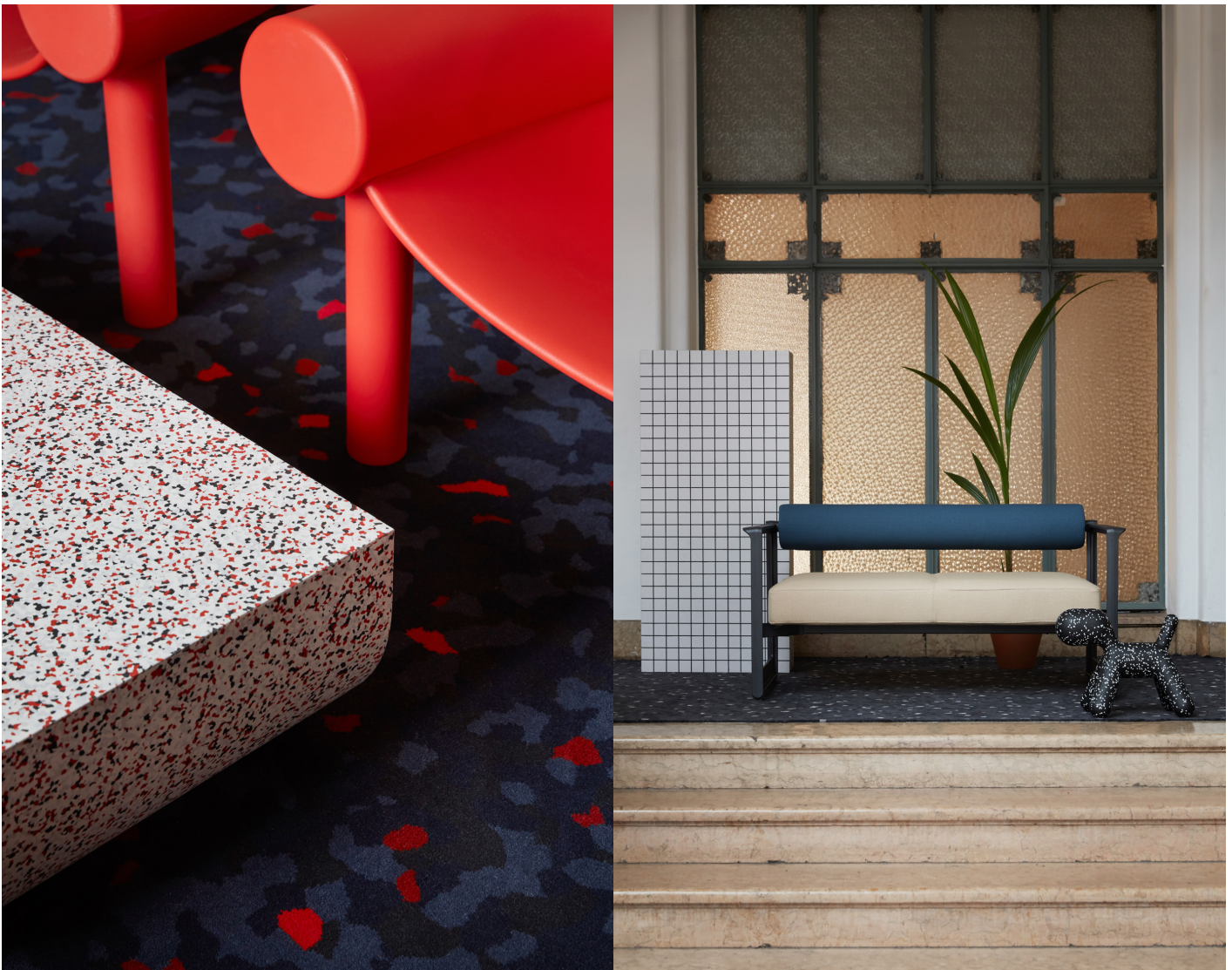
I utställningens mitt finns en yta med ett urval av Magis tidlösa ikoniska objekt, en perfekt utsiktspunkt att sitta ner och njuta av Formations.

I utställningen har Tarkett valt att samarbeta med italienska möbelvarumärket Magis. Båda företagen delar värderingar och en designriktning som tänjer på gränserna och utmanar normen. Magis är ett familjeägt entreprenöriellt företag, känt för sina banbrytande tidlösa produkter. De arbetar med ett flertal internationellt kända designers för att skapa kvalitativa kollektioner med hög funktionalitet. I Formations visas några av Magis ikoniska verk som exempelvis Konstatin Grcic's soffa Brut som speglar installationens arketypiska former och reflekterar iQ Surface färgpalett.