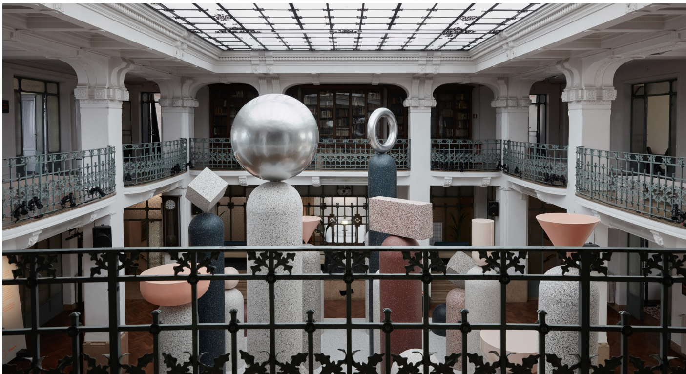
Volymer, proportioner, ytor och former samspelar i Formations.