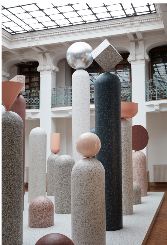
Koner, ringar, kuber och glober pryder pelarna i utställningen.

Former i olika skalor, lek med klassiska designprinciper, ett modernt industrimaterial som inte liknar något annat och en ikonisk byggnad mitt i Milano – välkommen till utställningen Formations.