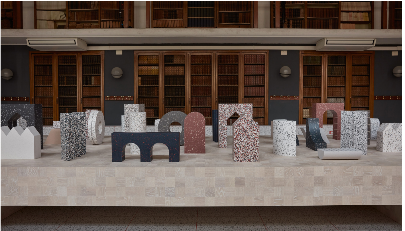
De kreativa möjligheterna med iQ Surface lyfts fram i biblioteket.