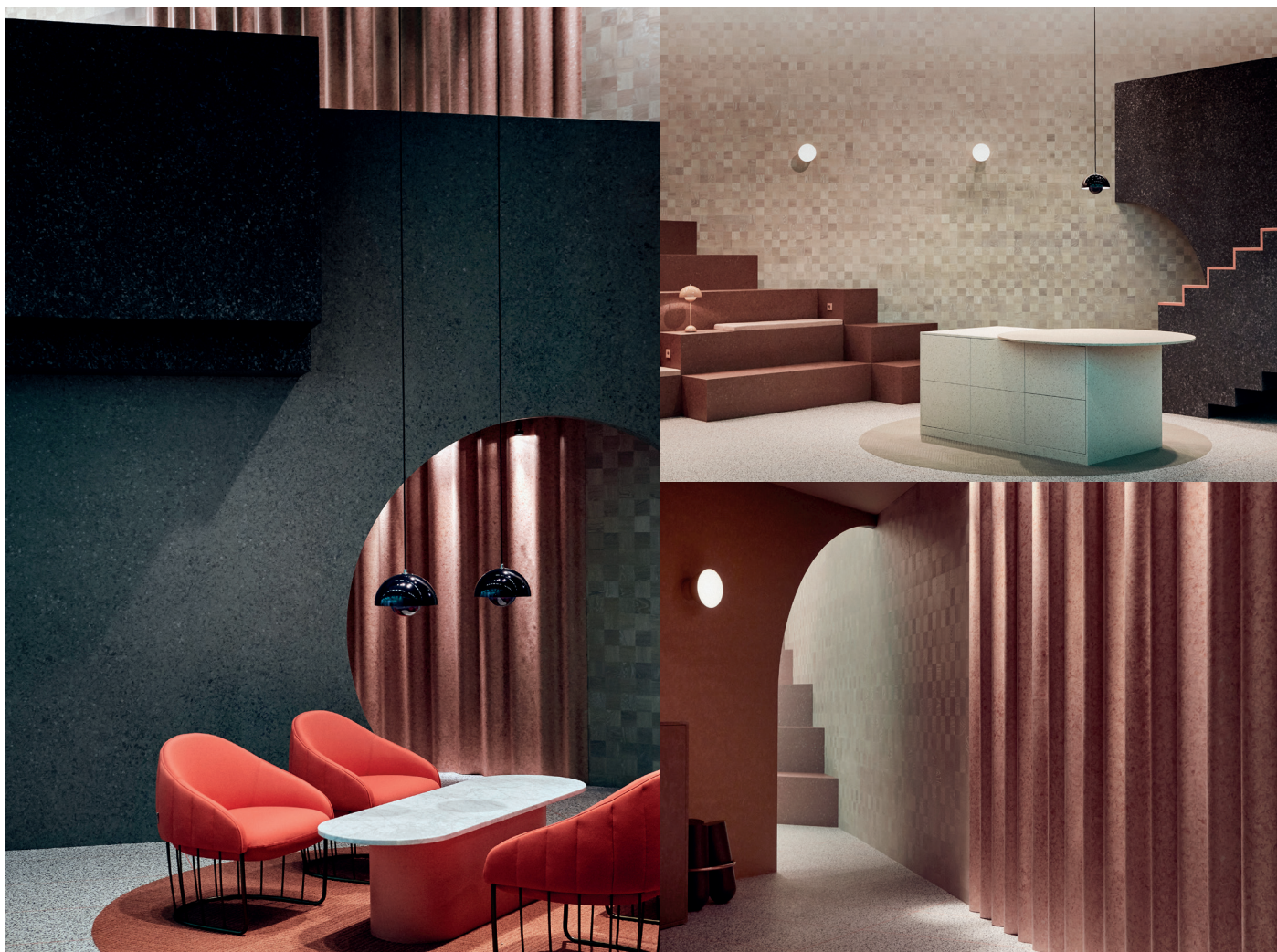
The Lookout designades av Note Design Studio som skapade en formstark installation för att visa nya perspektiv och användningsområden för golv.