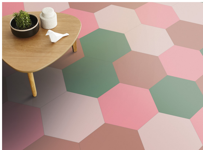
Colourful Place är stilen som visar fantasi, individualism och lusten till ett eget personligt skapande.