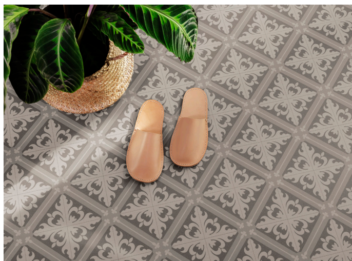
Eclectic Home är inredningstilen som speglar en passion för att upptäcka. Här blandas kontrasterade kulörer och texturer med unika objekt.