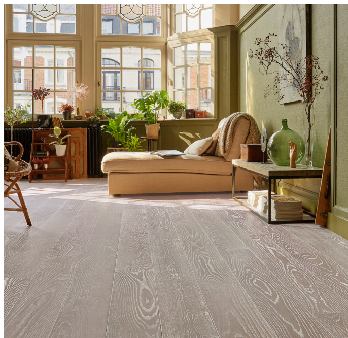
Trägolvet Vintage Ek Lund visar ett robust golv med tydlig karaktär av naturliga inslag.