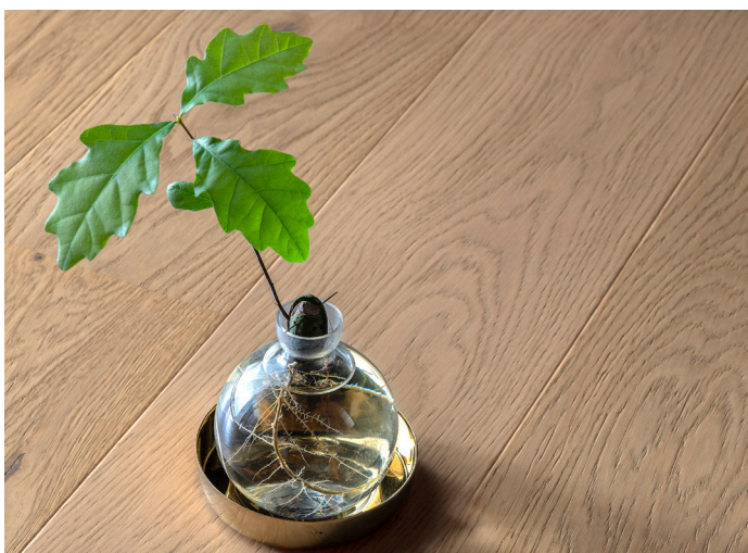
Green Factory är temat med en nära relation till naturen, där livsstilen handlar om att göra långsiktiga, medvetna golvval.