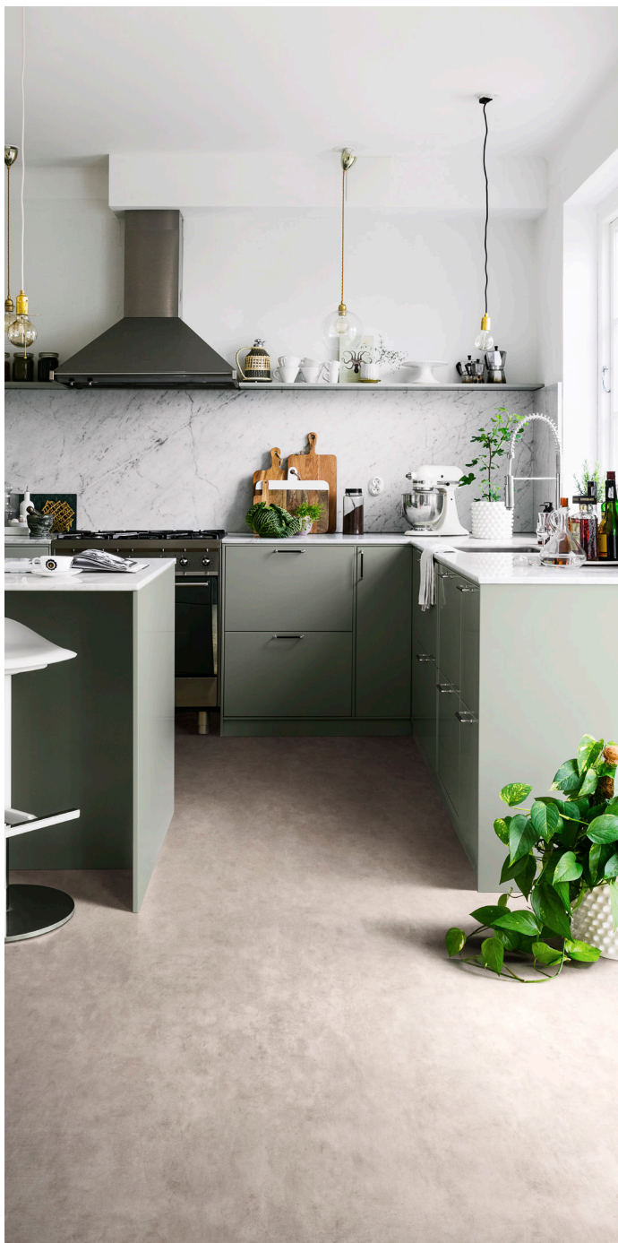
Vinylgolvet Tarkett Extra Stylish Concrete Light Grey i ett högaktuellt betongmönster. Ett praktiskt och tåligt golv till både kök och hall.

Temat Green Factory strävar efter den rätta balansen mellan det moderna och det traditionella. Inredningsstilen visar på vårt behov av naturen och integrerar gärna dess element i vardagen. Du bygger din livsstil genom att inreda hållbart. Golv i material och mönster som betong, marmor och rustika plank är högaktuella i temat Green Factory.