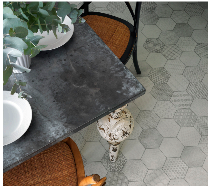
Vinylgolvet Tarkett Trend Henna White har ett mönster med olika hexagon-rutor i ljusa nyanser.