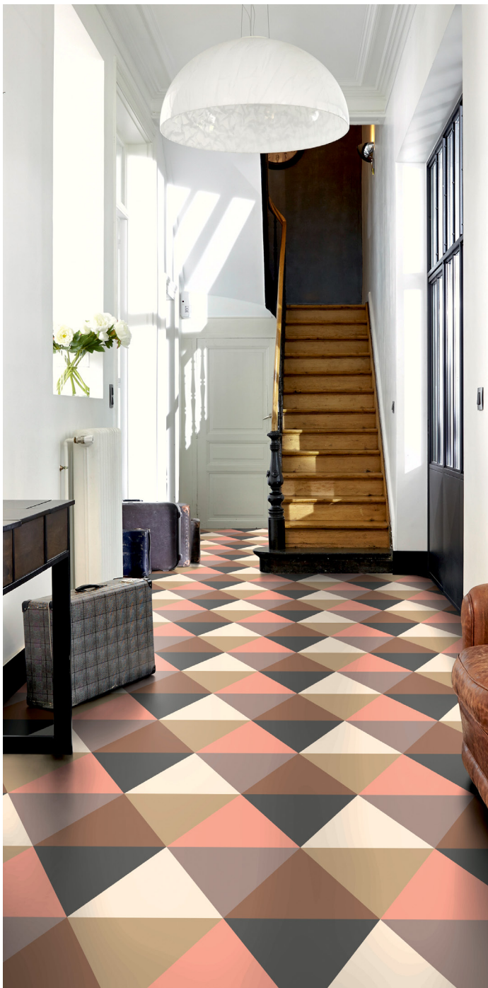
iD Mixonomi är ett modulärt vinylgolv med tio olika geometriska former som mixas med varandra. Paletten består av 33 kulörer.

Fantasi, individualism och eget skapande symboliserar stilen Colourful Place. Här letar vi efter nya formspråk, inspireras av vintage-föremål och håller det tillrättalagda på avstånd. Nyckelord är att hitta det lekfulla, för att på den vägen inreda ett varmt och mysigt hem. Tarketts olika golv ger fantastiska möjligheter.