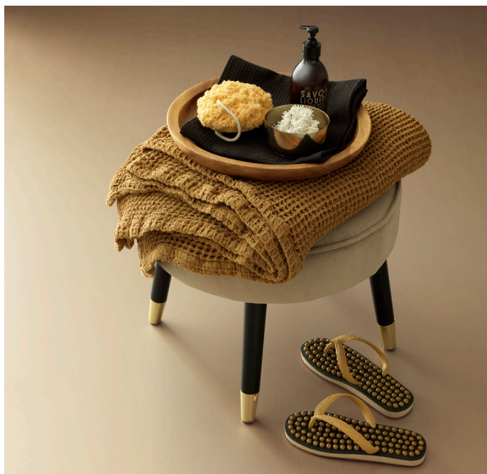
I Tarketts våtrumskollektion Aquarelle ingår Brushed Metal Gold -- en behaglig och ombonad kulör att använda till badrummet.