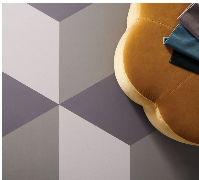
Det modulära vinylgolvet iD Mixonomi ger med sina färger och former ett personligt uttryck. Golvet installeras av en duktig golvläggare.

Nyheten Prestige Ek Granite är plank behandlade med en speciell "antikborstningsteknik". Det ger en både mjuk och rustik framtoning.