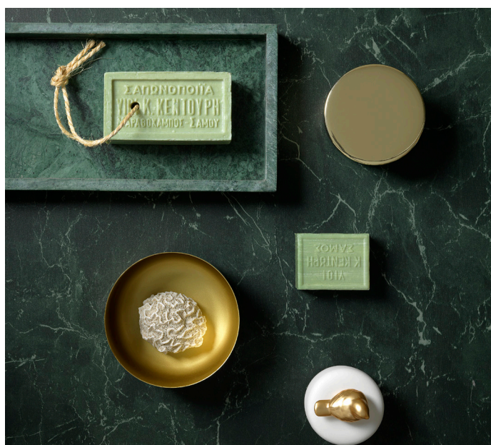
Det vackra gröna marmormönstret Royal Marble Green tillhör Tarketts designade våtrumskollektion Aquarelle.