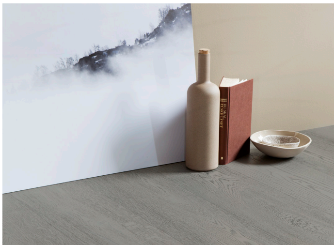
Urban Cocoon inspireras av "less is more" och att välja sina detaljer med största möjliga omsorg.

Fantasi, individualism och det egna skapandet symboliserar temat Colourful Place . Green Factory visar vårt behov av att vara nära naturen och integrerar gärna dess element i vardagen. Här bygger du din livsstil genom att inreda hållbart. Dessutom är golv i material och mönster som betong, marmor och rustika plank högaktuella. Temat Eclectic Home mixar gärna färgstarka kulörer och olika texturer med unika objekt.