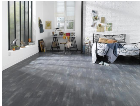
Starfloor Click 30, Colored Pine

Starfloor Click est adapté à toutes les pièces de la maison y compris les pièces humides. La collection se décline en deux épaisseurs: Starfloor Click 30 et Starfloor Click 50 , une solution extrêmement résistante.