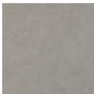
Collection Tarkett, Acczent Compact Esquisse