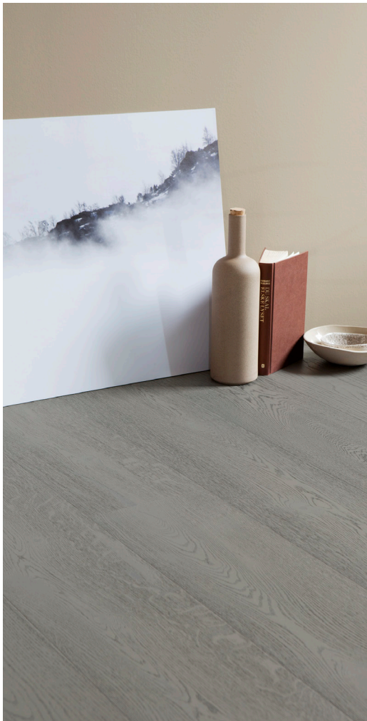
Heritage Tammi Dove Grey saa miellyttävän lämpöisen sävynsä harmaaksi sävytetystä kovavahaöljystä.

Heritage-malliston uutuudet ovat Heritage Tammi Opal White ja Heritage Tammi Dove Grey . Näiden ylellisten lankkuparkettien puuraaka-aine on valittu nimenomaan elävän vaihtelun, oksankohtien ja halkeamien perusteella. Parketin pinta on lisäksi harjattu, jotta puun yksityiskohdat saadaan vieläkin kauniimmin esiin. Jokainen lankku on vielä viimeistelty käsintehtyllä viisteellä.