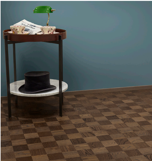
Noble Tammi Chelsea ruskeine sävyineen saa inspiraationsa englantilaisesta herrainhuoneesta.