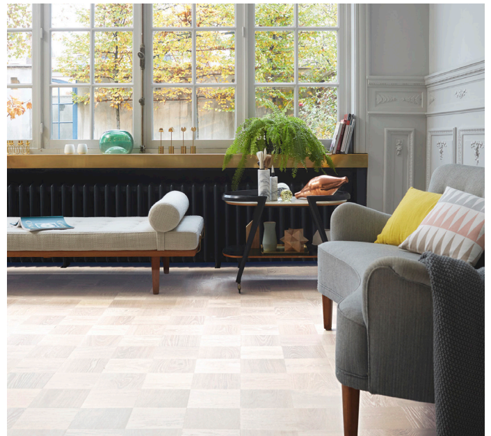
Noble Tammi Greenwich -lattian helmiäisenhohtoinen sävy yhdistää klassisen ruutukuvion moderniin designiin.

Kaikki Noble- ja Heritage -mallistojen lattiat ovat helppoja asentaa kätevä 2-lock-lukitusjärjestelmän ansiosta. Lattiat voidaan hioa uudelleen 3–4 kertaa ja niiden alle voidaan asentaa lattialämmitys. Myös pohjoisen ilmastomme vuodenaajoista johtuvat ilmankosteuden vaihtelut on huomioitu latioita suunniteltaessa.