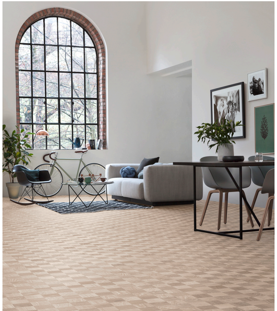
Noble Tammi Manhattanin sävy vaihtelee munankuoresta lämpimään beigeen, luoden ylellisen modernin ilmeen.