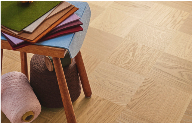
Noble Tammi Soho n kultainen sävy saadaan aikaan käsittelemällä pinta kevyesti vaalealla kovavahaöljyllä.