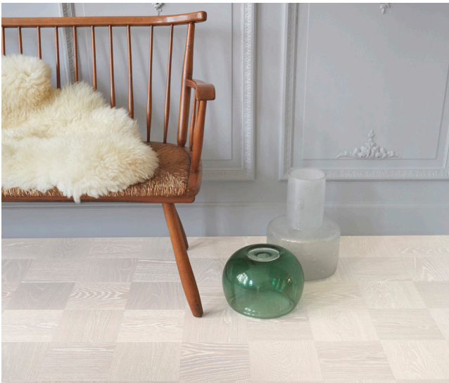
Noble Tammi Greenwich saa inspiraationsa New Yorkin taiteilija-ateljeiden selkeistä miiljöistä.

Noble-malliston suurempia ruutuja on saatavana kolmessa eri värissä: Noble Tammi Greenwich , Noble Tammi Soho ja Noble Tammi Broadway . Ruudut ovat 19x19 cm kokoisia. Parketin pinta on harjattu puusauvojen mukaisesti, ja huoneeseen tuleva valo heijastuu niistä upeasti eri suuntiin. Pintaa suojaa himmeän luonnollinen kovavahaöljy.