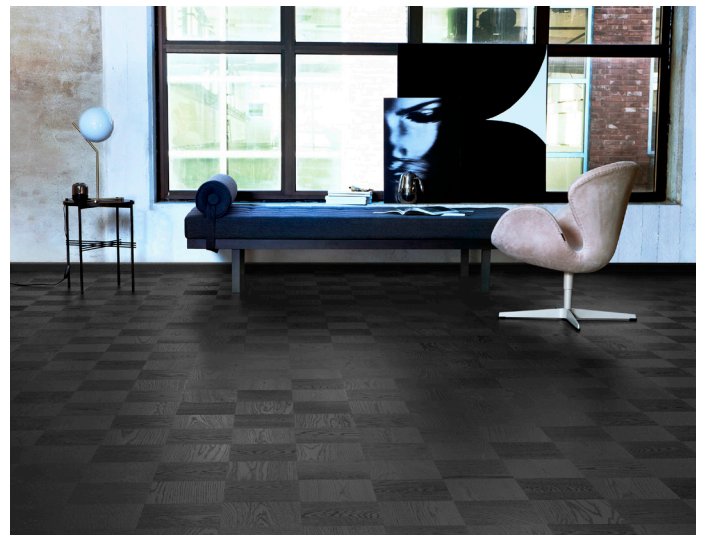
Uutuuslattia Noble Tammi Broadway , pinnassa musta neliönmuotoinen ruutukuvio.