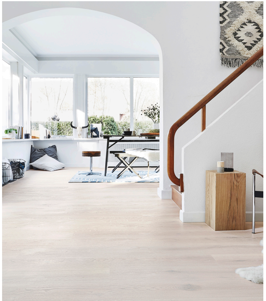
Kaunis Heritage Tammi Opal White on lähes peittävällä valkoisella kovavahaöljyllä käsitelty rustiikkinen puulattia.