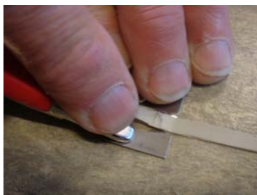
Ny dobbeltniv (Mozart)