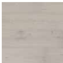
Elegance Eik Sterling