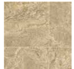
24052 | Goldstone Opal/Opale 36" x 36", 12" Drop, DNR 36" x 36", Décalé 12", NPI