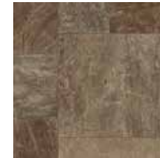
24001 | Norway Modular Grey/Gris 48" x 48", 38.5" Drop, DNR 48" x 48", Décalé 38.5", NPI