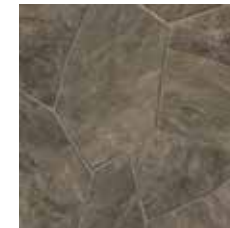
24031 | Pompano Mineral 36" x 36", 18" Drop, DNR 36" x 36", Décalé 18", NPI

Utilisation: Résidentielle Système d'Installation: Sans colle ou collé à la grandeur Niveau: Béton au-dessous, au-dessus et au niveau du sol, contre-plaqué approuvée et revêtement existant approuvé. Adhésif: Tarkett QBond-One™ Adhésion partielle - Appliquer l'adhésif de façon uniforme à l'aide d'un rouleau à peinture à poils court. Permettre à l'adhésif de devenir collant au toucher. Adhésion permanente - Appliquer l'adhésif à l'aide d'une truelle à brettelles 1/32" profond x 1/16" large x 1/32" d'écart. Placer le couvre-sol dans l'adhésif immédiatement après son application. Lors d'installation au-dessus d'un revêtement existant, permettre à l'adhésif de devenir collant au toucher. Coupe des joints: Sans Colle - Double-coupe à sec, utiliser le ruban à joint flottant Tarkett S875 sous les joints sur tout substrat recommandé & le ruban à joint Tarkett S860 sur substrat de béton. Collé à la grandeur (Adhésion partielle) - Double-coupe à sec. Ruban à joint non nécessaire. Collé à la grandeur (Adhésion Permanente) - Double-coupe à sec. Utiliser le ruban à joint Tarkett S860. Scellant à joint: Tarkett DT-65 (Fini mat)