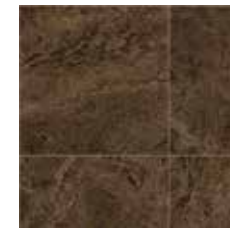
24051 | Goldstone Chocolate/Chocolat 36" x 36", 12" Drop, DNR 36" x 36", Décalé 12", NPI