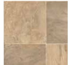
24021 | Canyon Slate Warm Sand/Sable Chaud 36" x 48", 12" Drop, DNR 36" x 48", Décalé 12", NPI