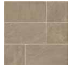
24041 | Slate Modular Earth/Terre 36" x 18", 18" Drop, DNR 36" x 18", Décalé 18", NPI