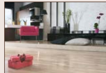
PRVI DAN PODNE