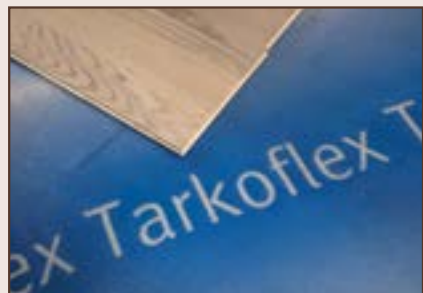
PRVI DAN UJUTRU