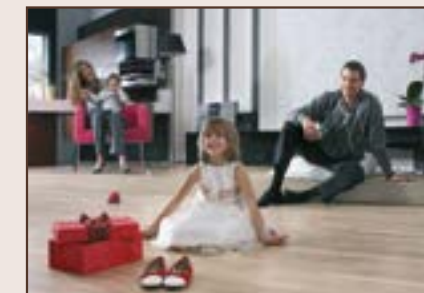
PRVI DAN POPODNE